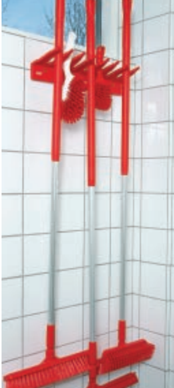
Προϊόντα που κρέμονται είναι πιο υγιεινά και έχουν μεγαλύτερη διάρκεια ζωής.