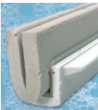
Το σφουγγάρι έχει φθαρεί και γίνεται μαλακότερο, άρα και πορώδες. Το προϊόν πρέπει να αντικατασταθεί ότι συμβαίνει αυτό.