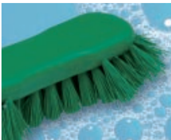
Η βούρτσα έχει χρησιμοποιηθεί σε μέρος που οι ίνες κόλλησαν και τραβήχτηκαν έξω. Η βούρτσα πρέπει να αντικατασταθεί.