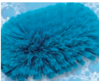
Οι ίνες έχουν μπερδευτεί λόγω μακροχρόνιας χρήσης. Η βούρτσα πρέπει να αντικατασταθεί.